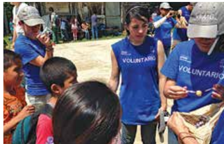
Actividades de voluntariado

Desde 2012, hemos apoyado a una comunidad cafetalera de la huasteca potosina. A través del donativo de activos productivos, esta comunidad ha logrado incrementar su producción de café más de 10 veces, aumentando, además, 47% el precio de venta de este insumo, generando mayores ingresos.