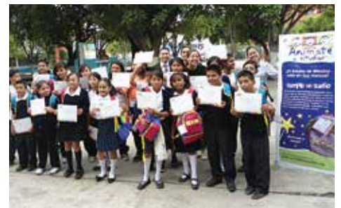
Fomento a la educación