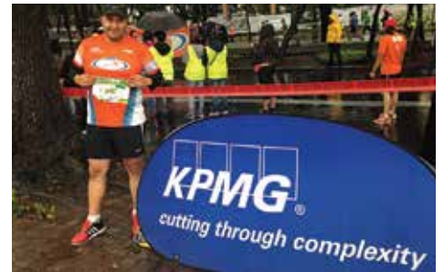
Corredores con causa