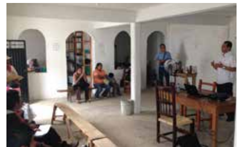
Donativos y servicios pro bono