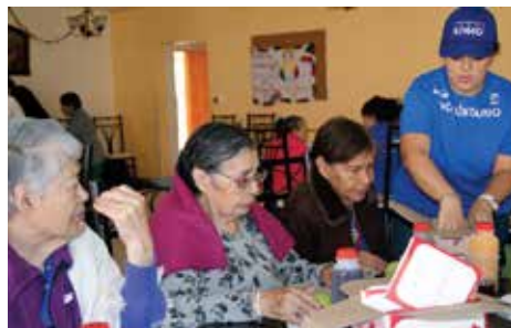
Día de Ayuda KPMG