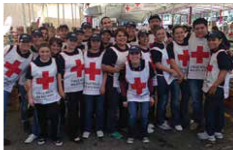
Apoyo ante desastres naturales